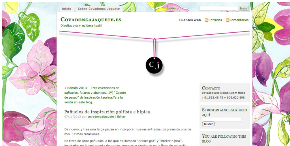
Ejemplo de mi propio blog.

Es importante tener una web y un blog en los que nuestros seguidores puedan obtener información sobre nosotros.